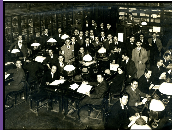
Ateneístas en la Biblioteca Sala de "La Pecera" (1930)